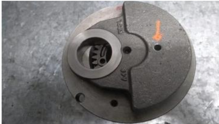
Imagem 3 – detalhe do furo na bolacha do virabrequim

4.7.2 - Permitida a realização de 1 (um) furo na bolacha do virabrequim com o único objetivo de facilitar o saque da engrenagem do balanceiro. Vide imagens 3, 4 e 5 abaixo.