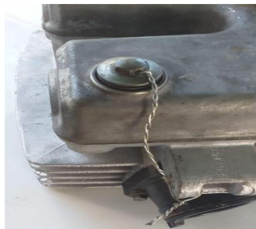
Imagem 2 – Detalhe furo passante no parafuso do cabeçote