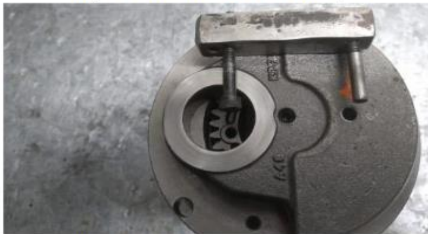
Imagem 4 – detalhe do furo na bolacha do virabrequim com ferramenta de saque