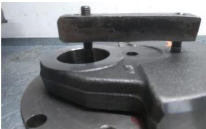
Imagem 5 - detalhe do saque da engrenagem com auxílio do furo e da ferramenta

4.9.4 – Permitido calçar o “pistonete” do carburador com anel “O-ring”.