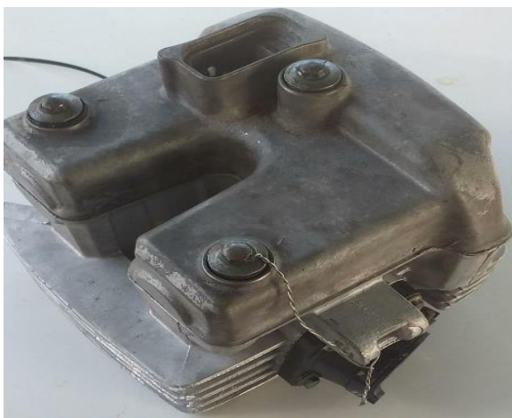
Imagem 1 – Detalhe furo passante no parafuso do cabeçote

4.2.8 – Obrigatória a realização de furo passante na “cabeça” do parafuso do cabeçote, para instalação de lacre conforme visto nas imagens 1 e 2 abaixo.