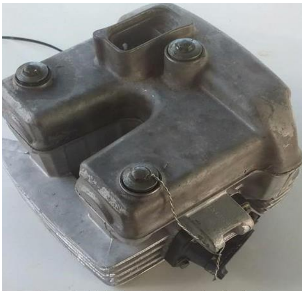
Imagem 1 – Detalhe furo passante no parafuso do cabeçote

4.2.8 – Obrigatória a realização de furo passante na “cabeça” do parafuso do cabeçote, para instalação de lacre conforme visto nas imagens 1 e 2 abaixo.