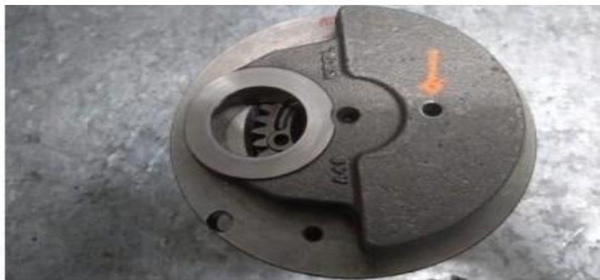
Imagem 3 – detalhe do furo na bolacha do virabrequim

4.7.3 - Permitida a realização de 1 (um) furo na bolacha do virabrequim com o único objetivo de facilitar o saque da engrenagem do balanceiro. Vide imagens 3, 4 e 5 abaixo.