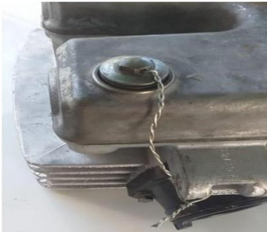
Imagem 2 – Detalhe furo passante no parafuso do cabeçote

4.3- COMANDO DE VÁLVULAS - Original do modelo ou paralelo desde que tenha as mesmas características e medidas dos originais. Permitido sacar as engrenagens e alterar o ponto.