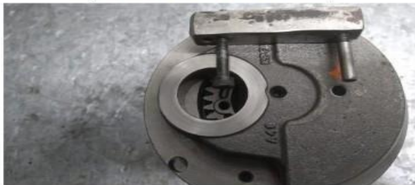
Imagem 4 – detalhe do furo na bolacha do virabrequim com ferramenta de saque