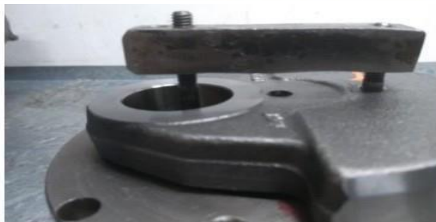
Imagem 5 – detalhe do saque da engrenagem com auxílio do furo e da ferramenta