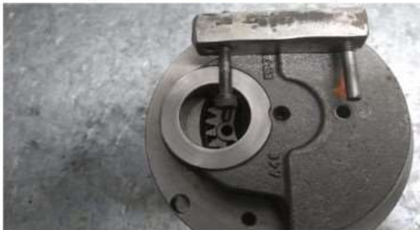
Imagem 4 – detalhe do furo na bolacha do virabrequim com ferramenta de saque