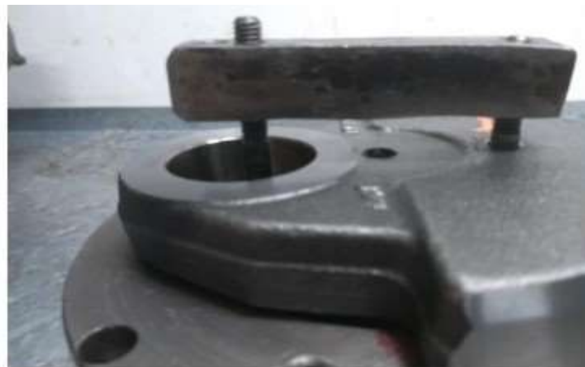
Imagem 5 – detalhe do saque da engrenagem com auxílio do furo e da ferramenta