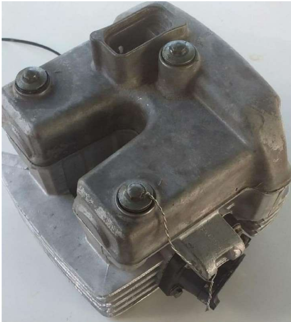
Imagem 1 — Detalhe furo passante no parafuso do cabeçote

4.3.8 – Obrigatória a realização de furo passante na “cabeça” do parafuso do cabeçote, para instalação de lacre conforme visto nas imagens 1 e 2 abaixo.