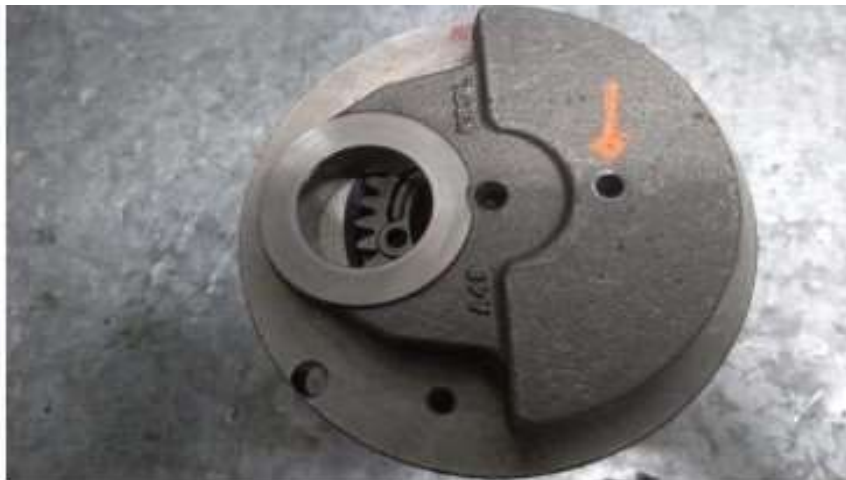
Imagem 3 – detalhe do furo na bolacha do virabrequim