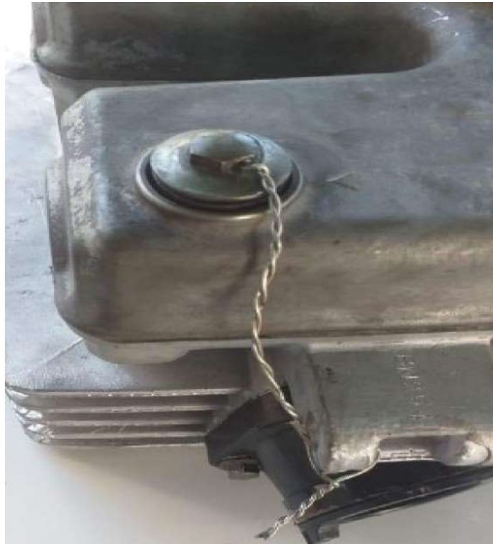
Imagem2 — Detalhe e furo passante no parafuso

4.4 - COMANDO DE VÁLVULAS - Original do modelo ou paralelo desde que tenha as mesmas características e medidas dos originais. Permitido sacar as engrenagens e alterar o ponto.