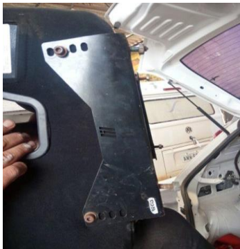
Suporte do Banco - Fixação Lateral