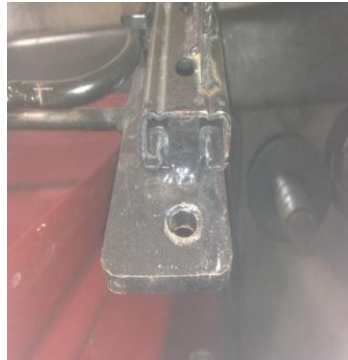
Suporte do Banco com Regulagem - Sugestão